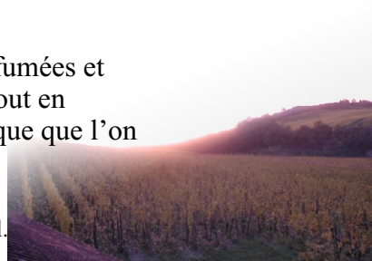
Lever du soleil sur le Blosenberg

Equilibre gustatif : Sec Rond Moelleux Liquoreux